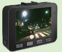
画像はイメージです。

ビデオ出力機能搭載 ビデオ出力機能付ですので、車載モニターテレビ等にAVケーブルを接続して記録映像を再生することができます。 ※AVケーブルは付属されていません。別途、市販のAVケーブルをお買い求めください。